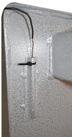
Рис.1. Пример установки баллона терморегулятора в гильзе котлов КАРАКАН

ПУЭ разрешается эксплуатировать в помещениях при температуре от +5 °С до +40 °С, влажности воздуха до 80% (при t +25 °С). Окружающая среда - невзрывоопасная, не содержащая агрессивных газов и паров, токопроводящей пыли.