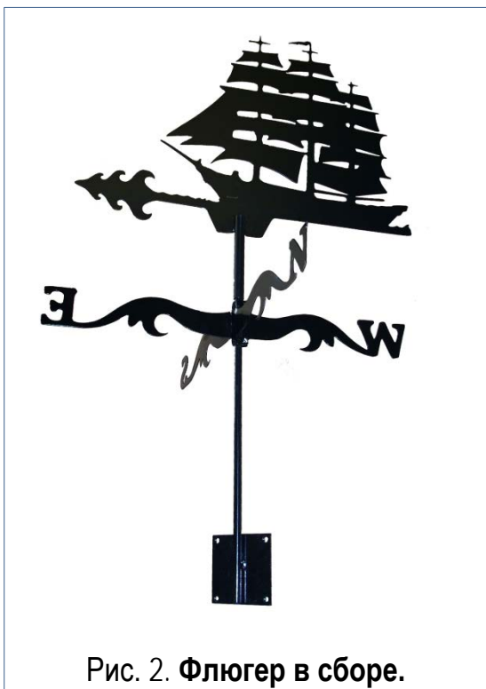
Рис. 2. Флюгер в сборе.