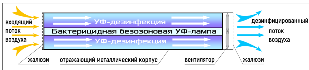
Рисунок 1. Схема обеззараживания воздуха в облучателе.

2.7. Процесс обеззараживания воздуха происходит внутри корпуса прибора (см. рис.1).